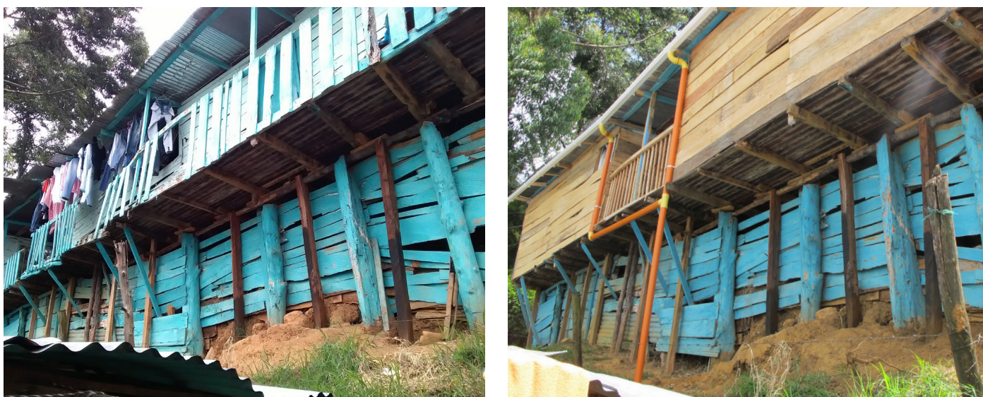
Figuras 14 y 15: Aquí se puede ver la casa “La Mona” (punto de monitoreo número 2) antes y después de las obras de mitigación.

La participación comunitaria en la ejecución de las obras también implicaba preparar y transportar los materiales hacia las áreas de mitigación. En este proceso se identificaron mujeres y hombres con conocimientos en construcción. Estas personas, coordinadas desde la organización social, fueron convocadas para ser ayudantes, generando un beneficio mutuo.