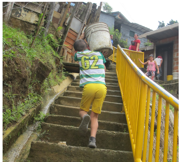
Figuras 10 y 11: La participación comunitaria en la ejecución de las obras también implicaba preparar y transportar los materiales hacia las áreas de mitigación. En este proceso se identificaron mujeres y hombres con conocimientos en construcción. Estas personas, coordinadas desde la organización social, fueron convocadas para ser ayudantes, generando un beneficio mutuo.