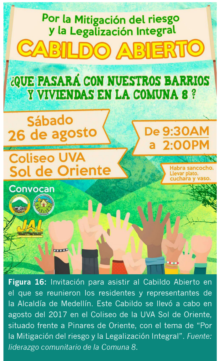
Figura 16: Invitación para asistir al Cabildo Abierto en el que se reunieron los residentes y representantes de la Alcaldía de Medellín. Este Cabildo se llevó a cabo en agosto del 2017 en el Coliseo de la UVA Sol de Oriente, situado frente a Pinares de Oriente, con el tema de “Por la Mitigación del riesgo y la Legalización Integral”.

El taller realizado con la comunidad y las