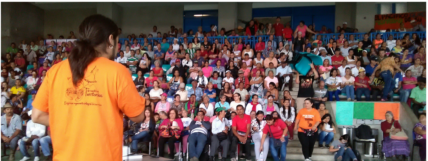
Figura 17: En el Cabildo, el equipo de investigación expuso los objetivos y métodos del Proyecto, y a continuación los representantes comunitarios de la Comuna 8 expusieron sus propuestas para la mitigación del riesgo y la legalización integral.

En el taller entre la comunidad y el sector terciario, se confirmó el reconocimiento de la capacidad de la comunidad para afrontar el riesgo de deslizamiento mediante el monitoreo y con obras pequeñas de mitigación de emergencia, la necesidad de afrontar el riesgo en el corto plazo, y la pertinencia de enfoques similares en el suministro provisional de otros servicios públicos tales como acueductos. Se resaltaron varios factores a tener en cuenta con respecto a las relaciones entre la comunidad y entidades externas que pudieran apoyar dichos procesos: la incidencia de las diferencias entre la actitud oficial y la visión personal o incluso profesional; el peligro de que se establezca una relación de dominancia de las instituciones sobre la comunidad, por ejemplo con respecto a la propiedad intelectual de las imágenes recogidas en el monitoreo y el uso que se pudiera hacer de las mismas, que podría afectar negativamente la relación entre los actores; la necesidad de generar y mantener la confianza entre los actores, reconociendo lo que aportan las comunidades al proceso; la necesidad de evitar el uso del riesgo como discurso político para expropiar el territorio; el papel que pueden tener actores tales como las universidades y las ONGs, que pueden actuar como intermediarios, proporcionar apoyo, y ayudar a acceder a recursos.