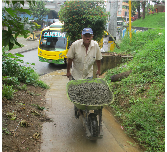
Figuras 8 y 9: Como contraprestación de las obras, el proyecto requiere reducir costos y gastos para hacer más eficientes los recursos y aumentar la participación, por tal motivo, la comunidad beneficiaria brindó una parte de la mano de obra para realizar las obras, por medio de convites.