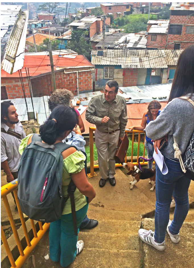
Figura 3: Caminata con residentes de Barrio Pinares antes del grupo focal.

El trabajo continuo con la comunidad durante las actividades relacionadas con monitoreo, mitigación y concertación (ver Secciones siguientes) permitió además constatar los cambios en la forma en la cual se expresaron las percepciones de los residentes durante el proceso. La investigación permitió considerar las percepciones de los residentes en tres momentos: el de la llegada al barrio, el de la entrevista, y durante la implementación del monitoreo y de las obras de mitigación.