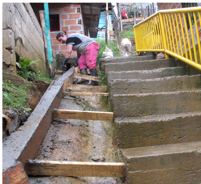
Figura 13: Como es tradicional en las comunidades de barrios en formación, las mujeres y los jóvenes de ambos sexos mostraron mayor participación en los convites que los hombres.

del suelo y al aumento de la amenaza de deslizamiento. Por otro lado, la conformación individual al inicio del asentamiento y su consolidación gradual pero dispersa, desorganizada y carente de un plan de conjunto, ha generado una serie de espacios residuales, con poca accesibilidad, próximos a los taludes, que sirven de separación entre las viviendas y que son foco de presencia de humedades y por lo tanto, fuente de conflicto entre vecinos. Estas zonas también generan la proliferación de flujos de agua erráticos y sin control, aspectos que refuerzan el riesgo por deslizamiento por la presencia generalizada de taludes descubiertos sin tratamiento y protección. Este aspecto requiere el análisis e identificación de medidas de control y protección más estructurales, que no estaba previsto en las dos medidas inicialmente propuestas, y que puede constituirse en otra medida de mitigación y en otra unidad de intervención complementaria cuando el asentamiento sea considerado para su mejoramiento y consolidación definitivo.