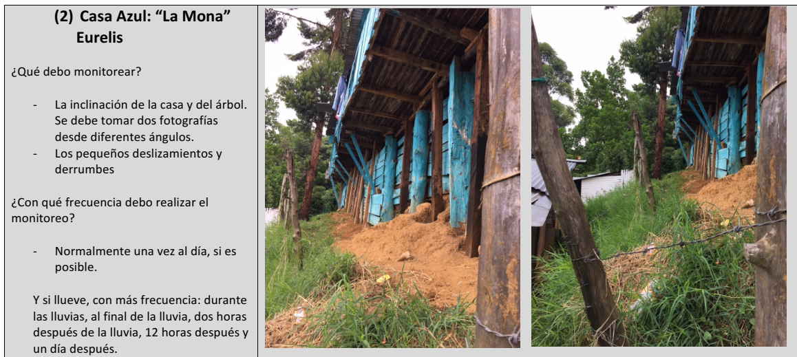
Figura 6: Una muestra del manual de capacitación para investigadores comunitarios. Este es el punto de monitoreo número 2 (ver Figura 5). El grupo técnico de monitoreo en Edimburgo elaboró este manual detallado para guiar a la comunidad en su trabajo de monitoreo. Indica: el punto a monitorear, la frecuencia de la observación y las condiciones de seguridad que debían tenerse en cuenta durante las acciones.