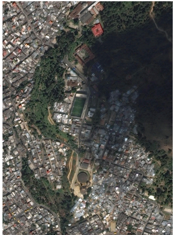
Figura 2: Imagen aérea del Barrio Pinares de Oriente de la Comuna 8.