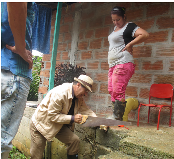
Figura 12: Entre las áreas de conocimiento del equipo de investigación se incluía la experiencia profesional en técnicas de construcción, que se puso a disposición de los residentes. Aquí uno de los profesionales del equipo muestra los principios de cómo preparar la formaleta en madera antes de llevar el concreto.