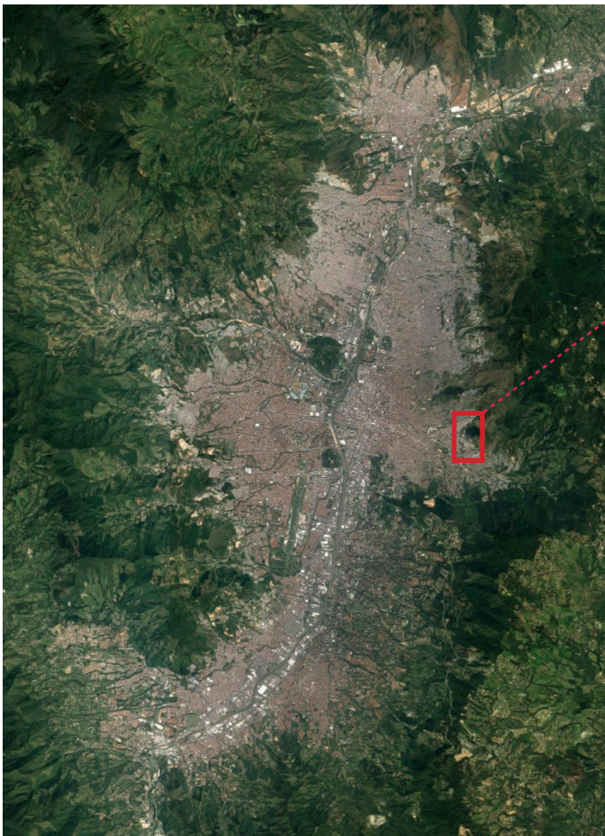
Figura 1: Imagen aérea de Medellín. El Barrio Pinares de Oriente de la Comuna 8 está destacado.

Las actividades desarrolladas para lograr estos objetivos se centraron en un barrio, localizado en la parte alta de la zona centro-oriental de Medellín, en la Comuna 8 de Medellín llamado Pinares de Oriente. Está situado entre las curvas de nivel 1.738 y 1.824 m.s.n.m., cubre 1.52 hectáreas, y está habitado por 180 familias, aproximadamente 800 habitantes, el 80% de los cuales son víctimas del conflicto social y armado interno que ha atravesado Colombia. Según el Plan de Ordenamiento Territorial Municipal, parte del barrio Pinares se encuentra sobre suelo de expansión para mejoramiento integral; y otra por fuera del perímetro urbano, es decir sobre suelo rural. La quebrada La Loquita 1 atraviesa el asentamiento, pero sólo transporta agua en periodos de intensa lluvia. La Municipalidad ha identificado en el barrio una zona sin riesgo en la parte baja, una zona de riesgo mitigable, y una zona de alto riesgo no recuperable, que coincide con la zona por fuera del perímetro urbano, donde se ubican aproximadamente 70 familias.