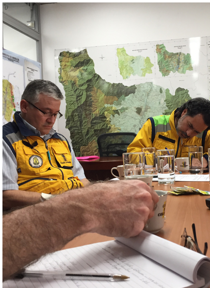
Figura 4: Entrevista semi-estructurada con DAGRD.