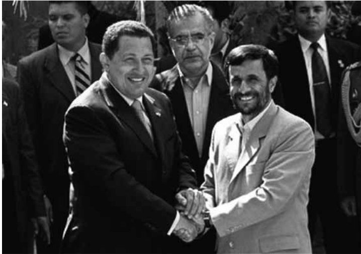
Iranian President Mahmoud Ahmadinejad (right) shakes hands with Venezuela's President Hugo Chavez, before an official welcoming ceremony for Chavez in Tehran, Iran, Saturday, July 29, 2006.

tingente del orden social, es decir, por la naturaleza de sus integrantes es cambiante. La naturaleza eventual, circunstancial del orden social, es lo que las comunidades tradicionales han tratado de eliminar con los intentos de homogenei-